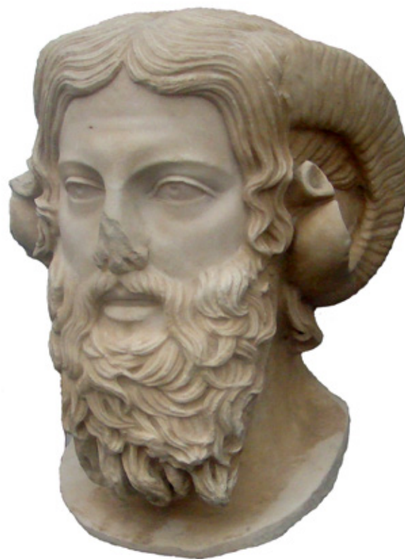
Сл. 3 Глава на Севс-Амон, мермер, Државна колекција на антиквитети и Глиптотека Минхен

дознаваме од легендите, е поврзано токму со ширењето на култот на Севс-Амон.